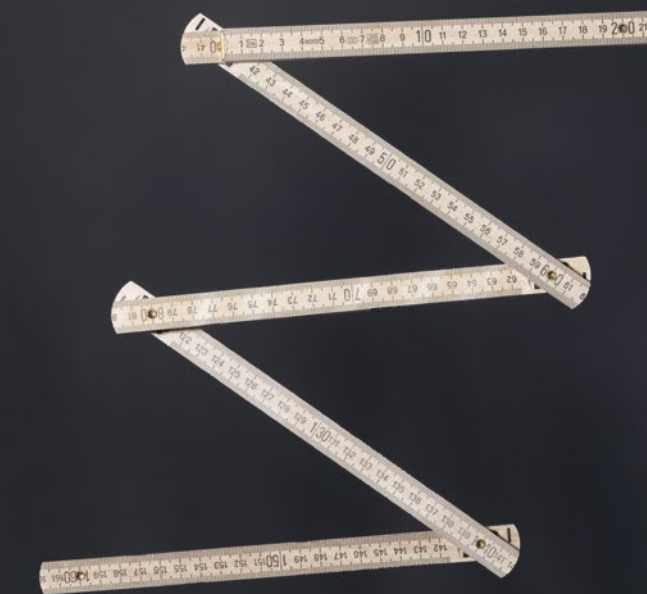
FELIX ULRICH Service, Montage

Seit fast 15 Jahren hat Eva bei uns den Überblick im Büro und hält mit ihrer Ruhe und Erfahrung vieles gleichzeitig in der Spur. 2023 wird sie als Prokuristin berufen und übernimmt weitere Aufgaben im Controlling.