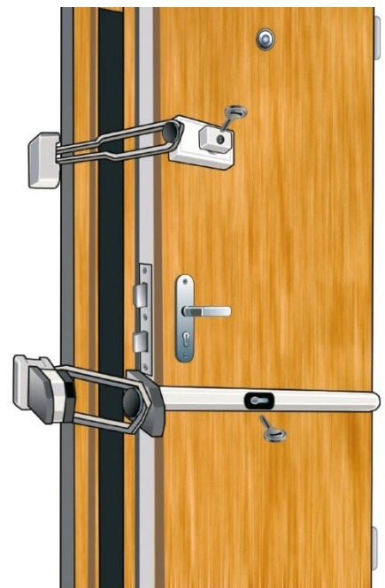
Wohnungseingangstür mit Aufschraubabsicherungen