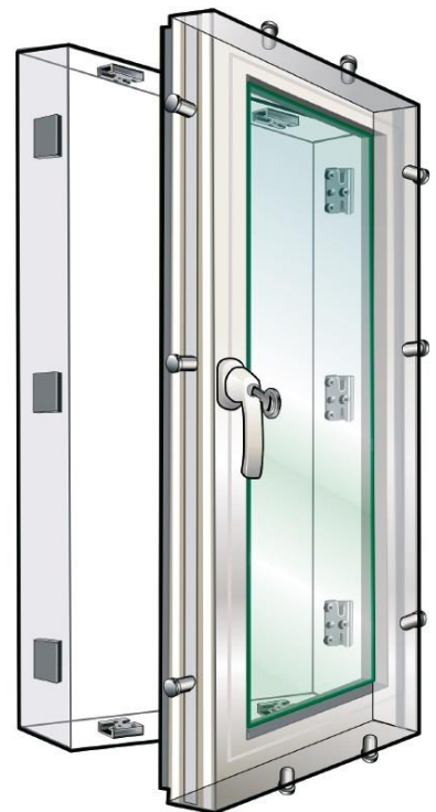
Fenster mit Pilzkopfzapfen, passenden Schließstücken und abschließbarem Fenstergriff